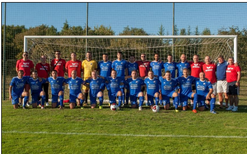
momčad veterana NK Garić – Garešnica