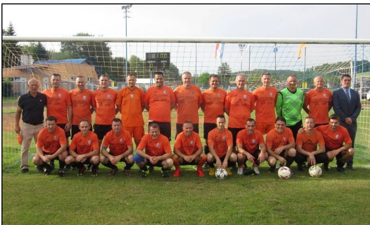
veterani HNŠK Moslavina Kutina – prvaci NS Kutina sezone 2018./2019.

Na 19. prvenstvu veterana HNS-a u Poreču od 28 do 30. rujna 2018., veterani HNŠK Moslavine u skupini „G“ u prvoj utakmici doživjeli su minimalan poraz 2:3 od momčadi Save iz Strmca, dok su i u drugoj utakmici također doživjeli identičan rezultat, poraz 2:3 od momčadi Rudar Dubrava Zabočka i tako završili skupinu na posljednjem trećem mjestu. Na prvenstvu je nastupila i momčad Sokol iz Velike Ludine koja je u skupini „H“ također doživjela dva poraza; Mladost Obrezina 0:7 i Velebit Benkovac 0:8 te isto tako kao posljednji u skupini završili svoj nastup na prvenstvu.