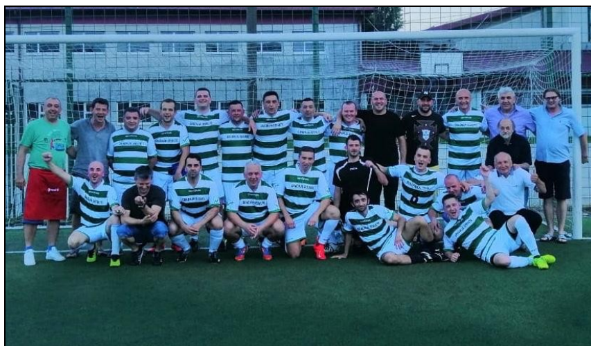
veterani nogometnog kluba Kašina PRS-ICT prvaci 1. lige skupina „B“, sezona 2018./2019.