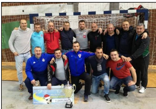
NK Garić – pobjednik zimskog MNT - veterani