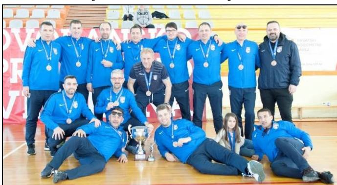
3. - mjesto: GOŠK-JUG Veteran 79, Dubrovnik