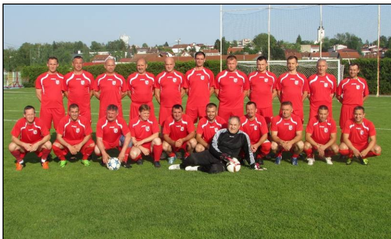
veteranska momčad NK Vrbovec prvaci veteranske lige NS Dugo Selo za sezonu 2018./2019.

Na 19. prvenstvu veterana HNS-a u Poreču od 28. do 30. rujna 2018., nastupila je momčad Vrbovca i odigrala dvije utakmice u skupini „F“ (Garić 0:1 i Sabunjar Privlaka 1:0). U skupini su osvojili 2. mjesto što im nije bilo dovoljno za plasman u osminu finala.