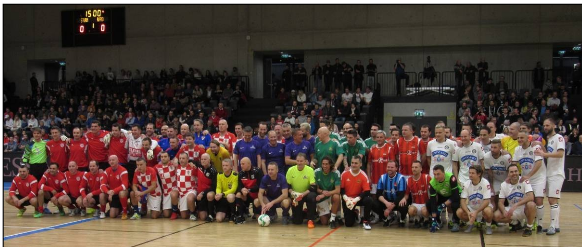
Zajednička slika svih sudionika