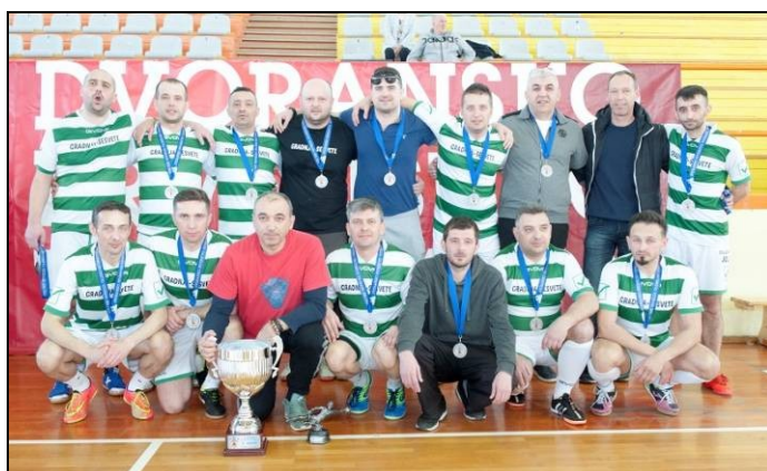
2. - mjesto: NK Kašina Gradnja Sestvete