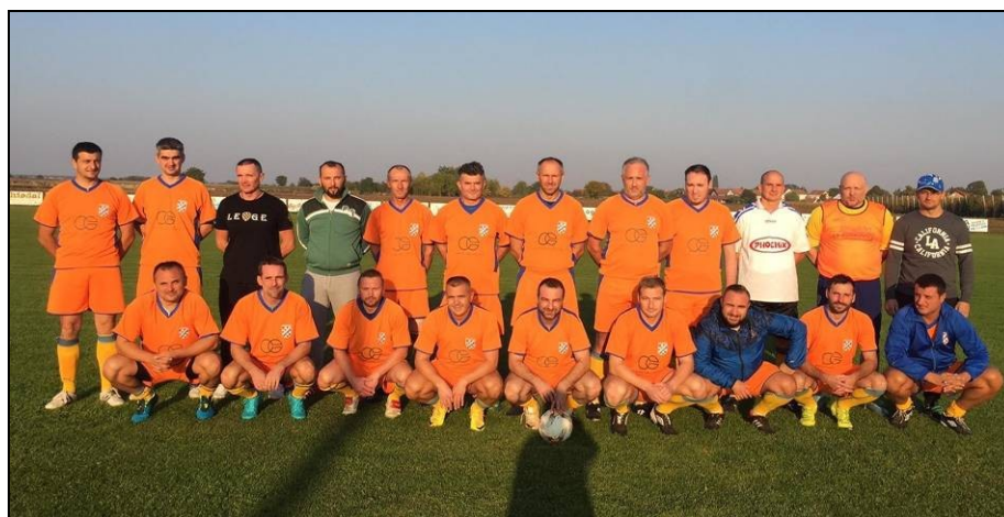
veterani NK Slavonac Tenja, pobjednici lige veterana za sezonu 2018./2019.