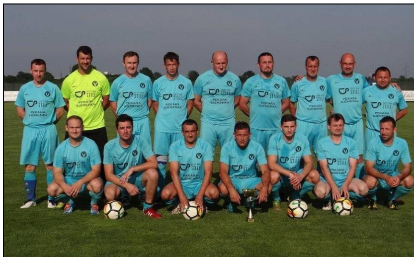
veterani NK „Vidovčan“ Vidovčan, prvaci skupine „A“ u sezoni 2018./2019.