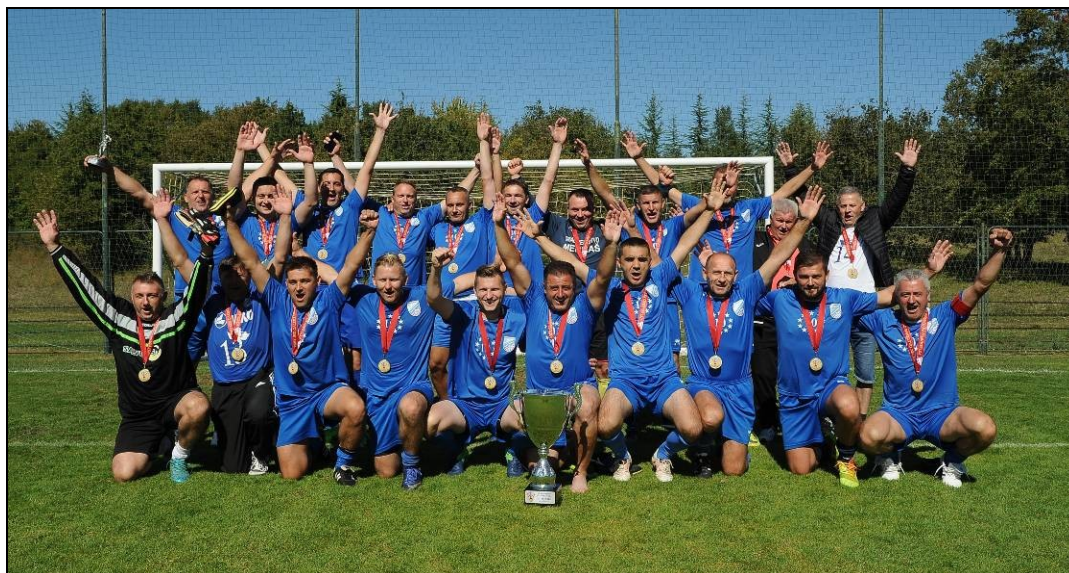
NK Zagorec Krapina – prvaci 19. prvenstva veterana HNS-a