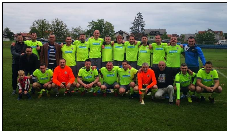
NK Zaprešić – veterani Prvaci LV NS Zaprešić sezone 2018./2019.

Na 19. prvenstvu veterana HNS-a u Poreču od 28. do 30. rujna 2018., momčad veterana Zaprešića u skupini „I“ u prvoj utakmici poraženi su od veterana Lepoglave 0:1, no u drugoj utakmici su bili uspješniji od momčadi Standard Nova Šarovka 3:0 te ostvarili plasman u osminu finala. U osmini finala poraženi su od veterana Zagorec Krapina 0:3.