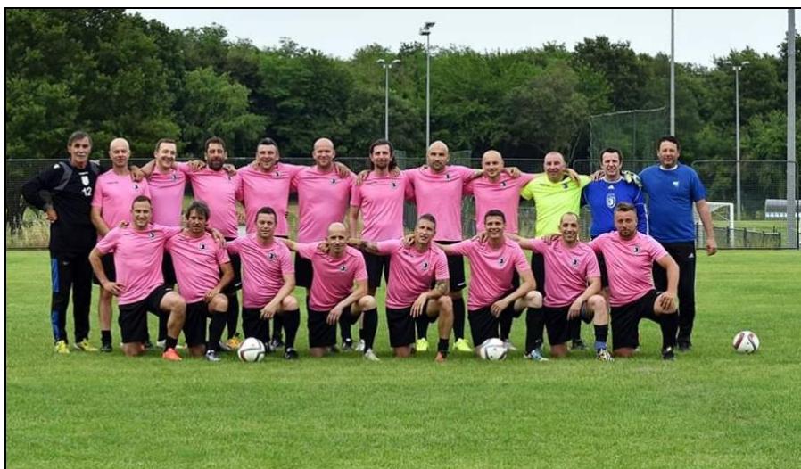
veterani NK Jadran Poreč, Prvaci lige skupine „SJEVER“ 2018./2019.