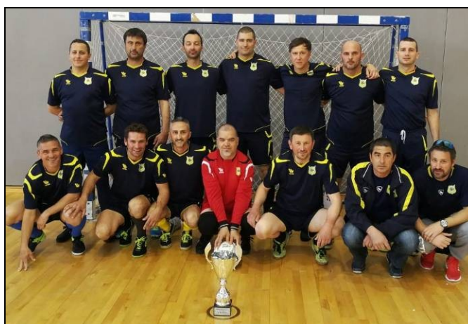
MNK Zlatna ribica, Brodarica Prvaci sezone 2018./2019.

Na 17. dvoranskom prvenstvu veterana HNS-a u Metkoviću od 15. do 17. veljače 2019. godine, iz NS Šibensko-kninske županije nastupile su čak tri momčadi (MNK Barutana, Šibenik, Futsal klub Banzogo, Šibenik i MNK Bilice)! Momčad MNK Barutana završila je svoj nastup na prvenstvu u skupini „C“ nakon dva poraza (Zagorec Krapina 1:3 i NK Slunj 2:4), a svoj nastup na prvenstvu u skupini, ali u skupini „F“ završio je i Futsal klub Banzogo, porazom od GOŠK-JUG veteran 79, Dubrovnik 0:2 i pobjedom nad veteranima Kašina Gradnja Sesvete 1:0, koji su također zauzeli posljednje treće mjesto. MNK Bilice u skupini „H“ odigrali su neodlučeno 0:0 sa veteranima Jadrana iz Poreča i 2:2 sa veteranima Mosora Žrnovnica i kao drugoplasirani u skupini plasirali se u osminu finala. U osmini finala pobijedili su VNK Remetinec Zagreb 2:0, dok su svoj nastup na prvenstvu završili u četvrtfinalu porazom od domaćina NK Neretva Metković 1:3.