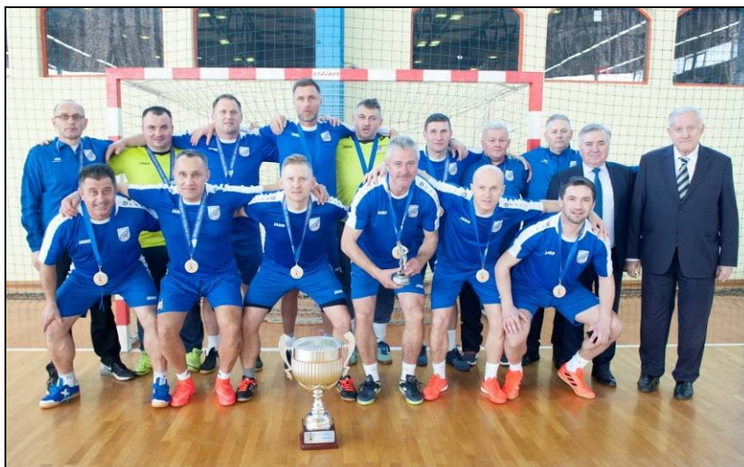
Veterani Zagorec Krapina – pobjednici 17. dvoranskog prvenstva HNS-a