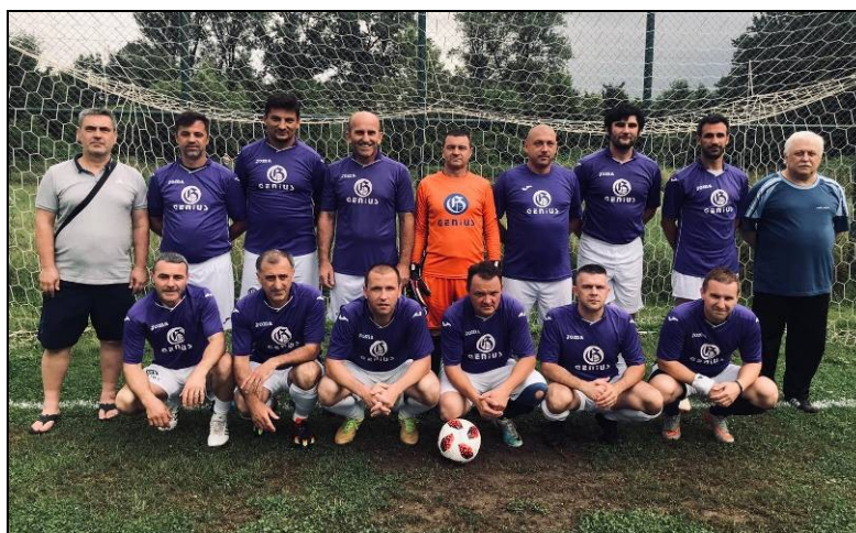
veterani nogometnog kluba DUBRAVA-GENIUS prvaci 2. lige skupina „B“, sezona 2018./2019.