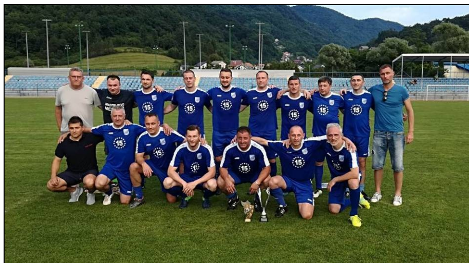
veterani NK Zagorec Krapina - prvaci I. ŽNL sezona 2018.-2019. prvaci su županije 15. put za redom!