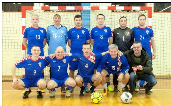
Cro Docs nastup na 17. dvoranskom prvenstvu veterana HNS-a