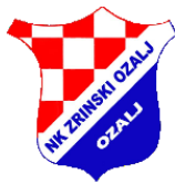
momčad veterana NK Zrinski-Ozalj prvaci lige veterana NS Jastrebarsko