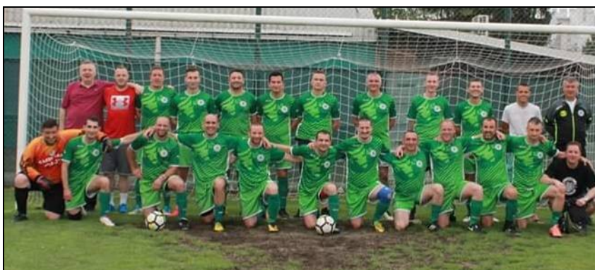
veterani nogometnog kluba Gajnice Zagreb prvaci 1. lige skupina „A“, sezona 2018./2019.