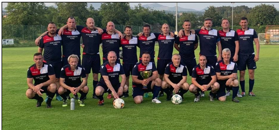
veterani NK Krk pobjednici skupine „B“