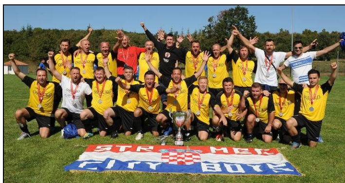
2. - mjesto: NK Sava Strmec