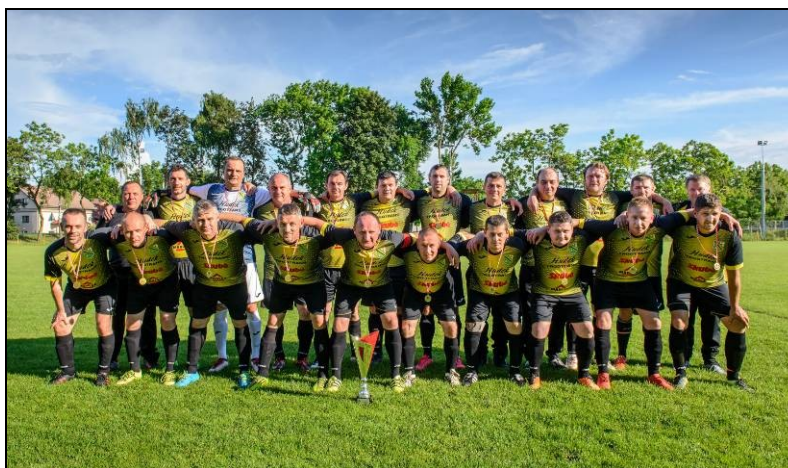
veterani NK Rudar 47, Ladanje Donje prvaci lige „ZAPAD“ u sezoni 2018./2019.

Na 19. prvenstvu veterana HNS-a u Poreču od 28. do 30. rujna 2018., nastupili su veterani Beretinca i Lepoglave. Momčad Beretinca u skupini „A“ doživjela je dva poraza (AK Siget-HD 1:3 i Radnik Majur 0:6) pa nisu nastavili daljnje natjecanje, jer su zauzeli posljednje mjesto u skupini. Momčad Lepoglave u skupini „I“ najprije je pobijedila veterane Zaprešića 1:0, a potom i Standard Nova Šarovka 4:0 i tako kao prvak skupine plasirala se u osminu finala. U osmini finala doživjeli su minimalan poraz od veterana Velebit Benkovac 0:1 te ispali iz daljnjeg natjecanja.