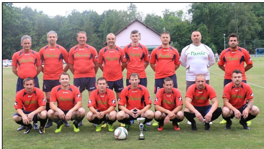
veterani NK Dubravčan, prvak lige skupine „Sjeverozapad“ za sezonu 2018.-2019.