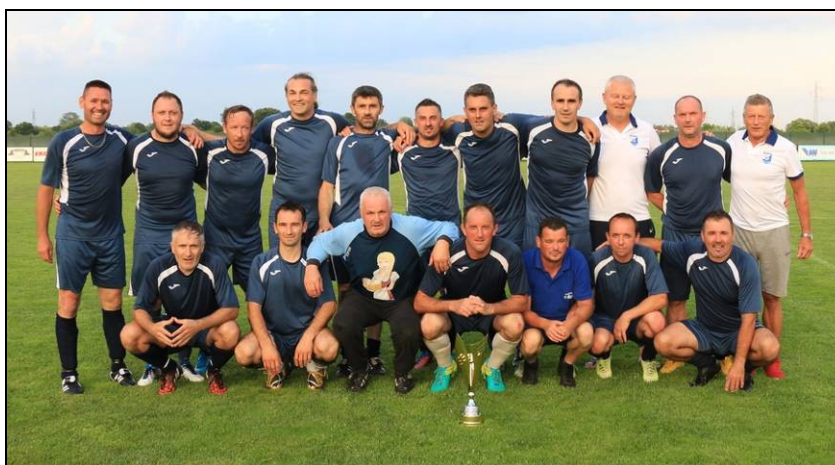
veteranska momčad NK Nedelišće prvaci lige skupine „B“ sezone 2018./2019. i ukupni pobjednici veterana Međimurskog nogometnog saveza