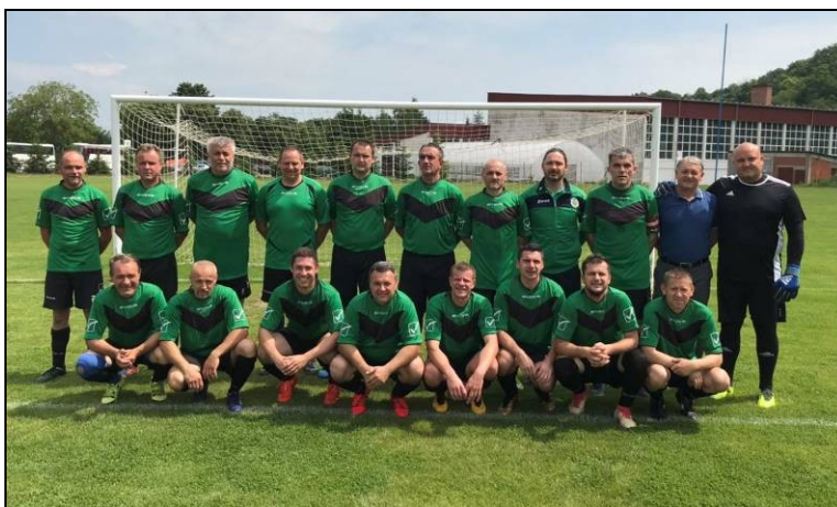
Pobjednici lige veterana, momčad veterana NK Mikleuš

Na 19. prvenstvu veterana HNS-a u Poreču od 28. do 30. rujna 2018., nogometni savez Virovitičko-podravске imao je čak tri predstavnika i to momčadi: Papuk Orahovica, Pitomača i Standard Nova Šarovka. Momčad Papuka u skupini „C“ u prvoj utakmici poražena je od Lokomotive Fimatosport 0:3, dok je u drugoj utakmici pobijedila momčad Budućnost Podbrest 3:1, zauzela drugo mjesto u skupini, no nisu ostvarili plasman u osminu finala. Momčad Pitomače u skupini „E“ najprije je odigrala 1:1 sa veteranima Pazina, a u drugoj utakmici poraženi od Opatije 0:4 te tako zauzeli posljednje mjesto u svojoj skupini. Ni Standard Nova Šarovka nije bio bolje sreće u skupini „I“, oni su poraženi u obje utakmice skupine (Zaprešić veterani 0:3 i Lepoglava 0:4), pa ni oni nisu ostvarili plasman u osminu finala.