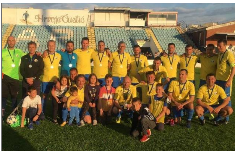
veterani NK Sabunjar Privlaka prvaci skupine „A“ sezone 2018./2019.