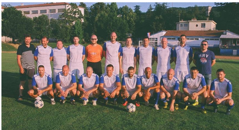
Pazin veterani pobjednici skupine „CENTAR“ i ukupni pobjednici Liga veterana NS Istarske županije