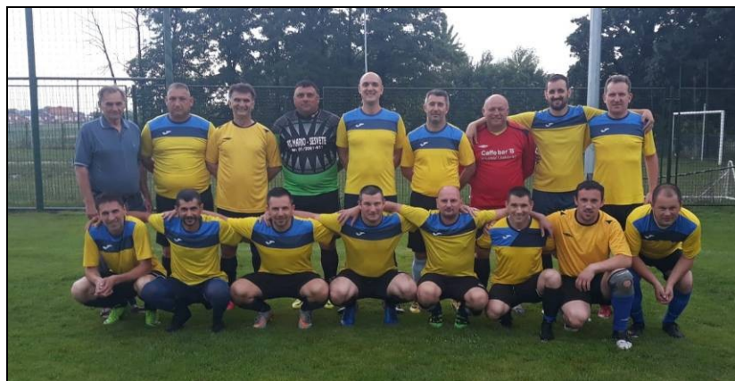
veterani nogometnog kluba Hrvatski Leskovac prvaci 2. lige skupina „C“, sezona 2018./2019.