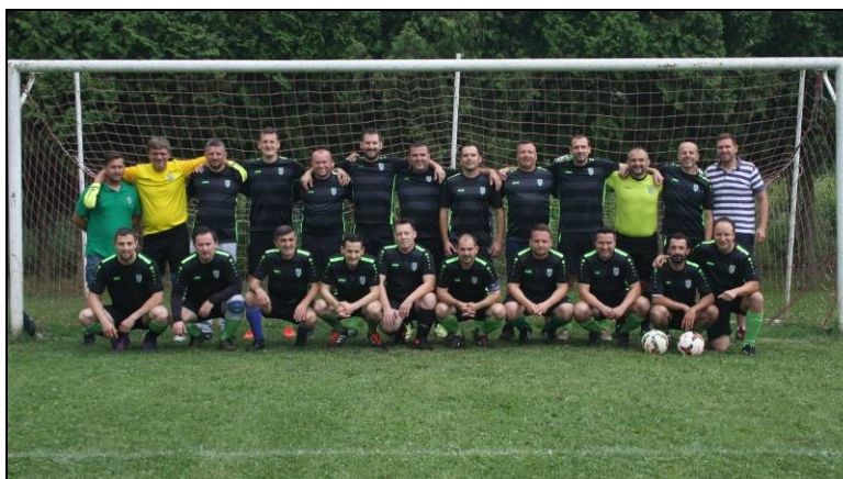
veterani nogometnog kluba Zanatlija Zagreb prvaci 2. lige skupina „A“, sezona 2018./2019.