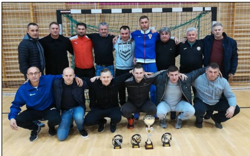
Prvo mjesto veterani NK Zagorec Krapina I