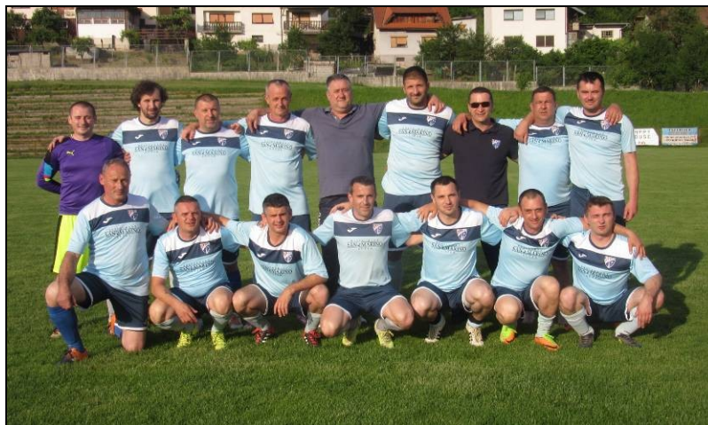
NK Slunj - prvaci LV NSKŽ sezone 2018.-2019.

Na 19. prvenstvu veterana HNS-a u Poreču 28. do 30. rujna 2018., Karlovačka županija imala je kao i svake godine predstavnika, tj momčad Zrinski-Ozalj. Zrinski-Ozalj je u skupini „J“ ostvario visoku pobjedu protiv veterana Trnave iz Goričana 4:0, dok je u drugoj utakmici minimalno poražen od veterana Dugopolja 0:1. S tri boda iz dvije utakmice zauzeo je drugo mjesto u skupini i plasirao se u osminu finala. U osmini finala čekala ih je momčad Sabunjar Privlaka gdje su doživjeli poraz 0:4!