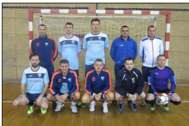
2. mjesto – NK Slunj