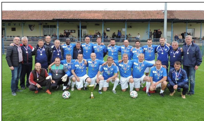
NK Osvit Đelekovec – Prvaci I ŽNL veterana

Na 19. prvenstvu veterana HNS-a u Poreču 28. do 30. rujna 2018., Koprivničko-križevačka županija imala je jednog predstavnika i to momčad Omladinac Herešin. Oni su u skupini „D“ doživjeli dva poraza; Jaska 1-3 i Zagorec Krapina 0-6 i na tako završili svoj nastup na prvenstvu. Na 17. dvoranskom prvenstvu veterana HNS-a u Metkoviću 15.-17. veljače 2019. godine, Nogometni savez Koprivničko-križevačke županije nije imao svog predstavnika.