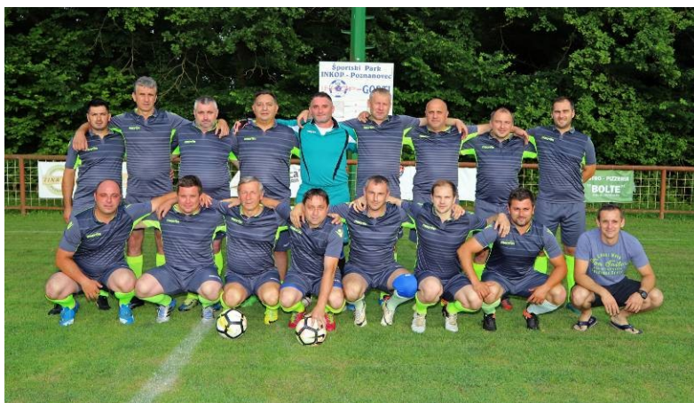
veterani NK „INKOP“ Poznanovec - prvaci II ŽNL i ostvaren plasman u I ŽNL od sezone 2019./2020.