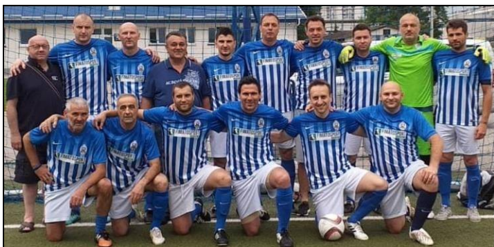
Lokomotiva Fimatosport viceprvaci Premier lige

Momčad VNK Jarun Zagreb završila je svoj nastup u skupini „I”. Oni su u razigravanju po skupinama najprije odigrali neodlučno protiv MNK Siscia Sisak 0:0, da bi u drugoj utakmici bili poraženi od MNK Pirovac 0:1 te kao posljednji u skupini ostali bez plasmana u osminu finala.