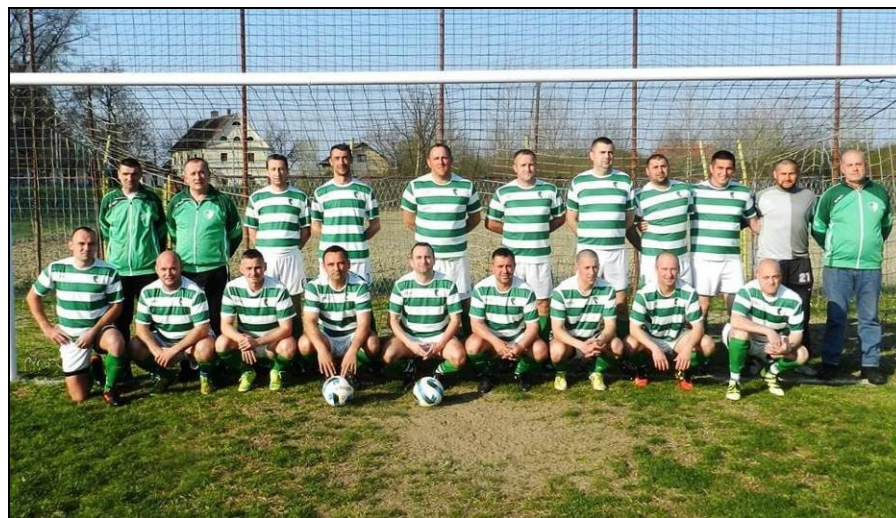
veterani ŠNK Radnik – Majur, prvaci u sezoni 2018./2019.

Na 19. prvenstvu veterana HNS-a u Poreču od 28. do 30. rujna 2018., veterani Radnika iz Majura ostvarili su sjajan rezultat, gdje su u konačnici došli do četvrtog mjesta. Oni su u skupini „A“ u prvoj utakmici na prvenstvu poraženi od momčadi AK Siget-HD 0:1, a pobijedili veterane Beretinca 6:0 i tako izborili plasman u osminu finala. U osmini finala napravili su veliko iznenađenje porazivši Lokomotivu Zagreb s 3:0, a u četvrtfinalu i Sabunjar Privlaku, također s 3:0. Polufinale je donijelo ogled protiv Save iz Strmca i nakon 2:2 poraženi su nakon izvođenja jedanaesteraca 6:7, dok su još jednom izvođenjem sedmeraca poraženi od AK Siget-HD 2:4 u razigravanju za treće mjesto.