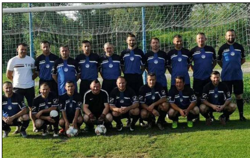
veterani NK Bednja Beletinec, prvaci lige „ISTOK“ u sezoni 2018./2019.