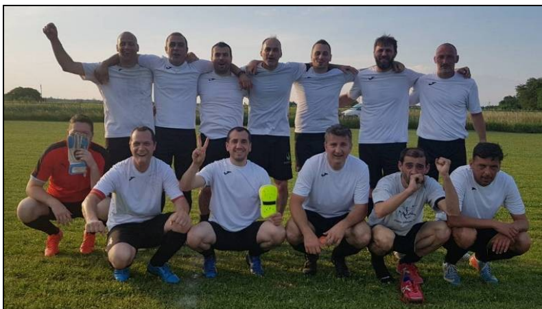
veterani NK Stari Grad Pula pobjednici skupine „JUG“