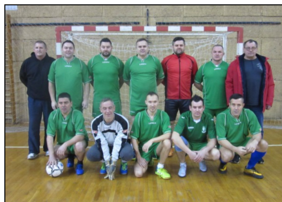
3. mjesto – NK Radnik Karlovac