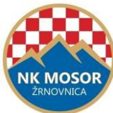
veterani NK Mosor Žrnovnica, Žrnovnica