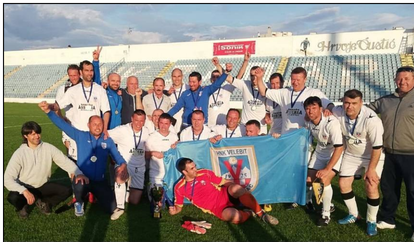
Veterani NK Velebit – Benkovac – prvaci sezone 2018./2019. u kupini „B“ te ukupni pobjednici veterana Zadarske županije