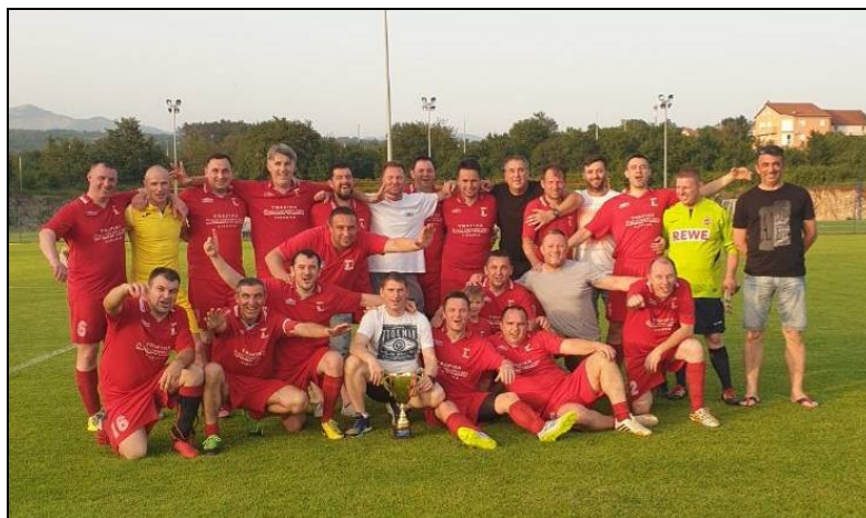
veterani Halubjan Viškovo pobjednici su skupine „A“ u sezoni 2018./2019. i ukupni pobjednici veterana NS Primorsko-goranske županije